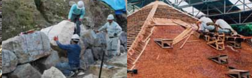
姫路城跡(特別史跡)の石垣修理