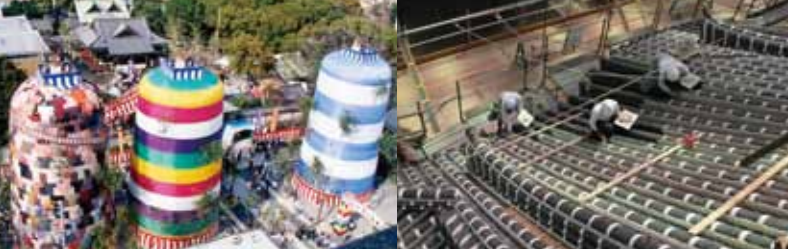
播磨総社一ツ山・三ツ山神事(国選択)